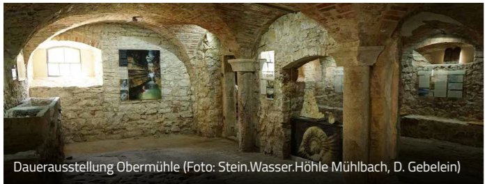
Dauerausstellung Obermühle