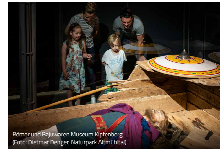
Römer und Bajuwaren Museum Kipfenberg

Alle Termine im Überblick unter www.naturpark-altmuehltal.de/museum/