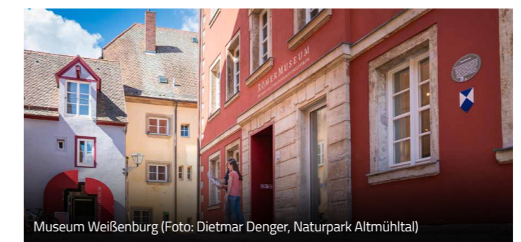
Museum Weißenburg

Mehr Infos zu Kosten und Anmeldung unter 09141 907186 und museen-weissenburg.de