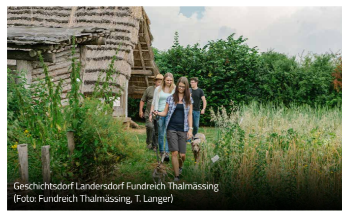
Geschichtsdorf Landersdorf Fundreich Thalmässing

Mehr Infos und Anmeldung auf bajuwaren-kipfenberg.de und unter 08465 90570