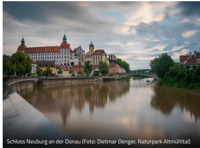
Schloss Neuburg an der Donau